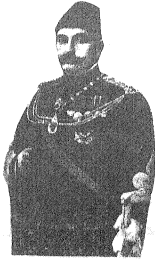
الخديوي عباس حلمي الثاني